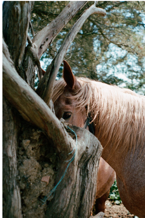
Bobine Magazine reportage