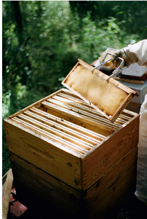
l'apithérapie article informatif