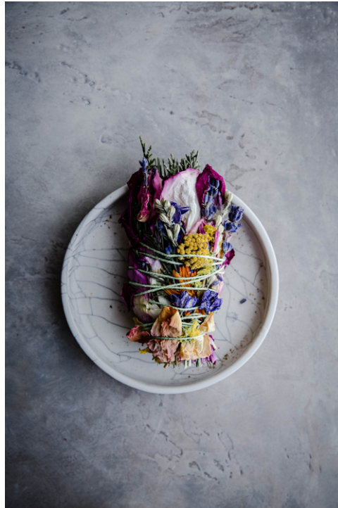
Introduction au véganisme

Collaboration avec Céline Steen, auteure de livres de cuisine végétarienne