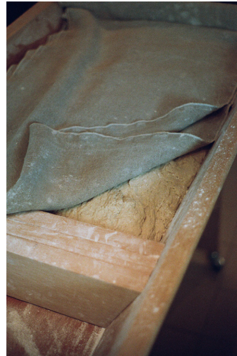
Boulangerie Maurice reportage