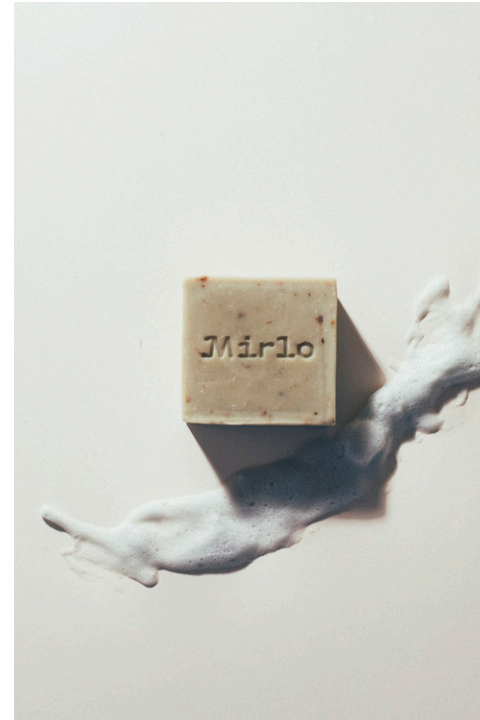
mirlo : soins botaniques article informatif