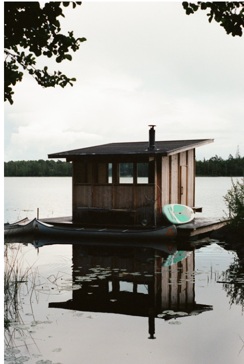
Stedsans in the woods reportage