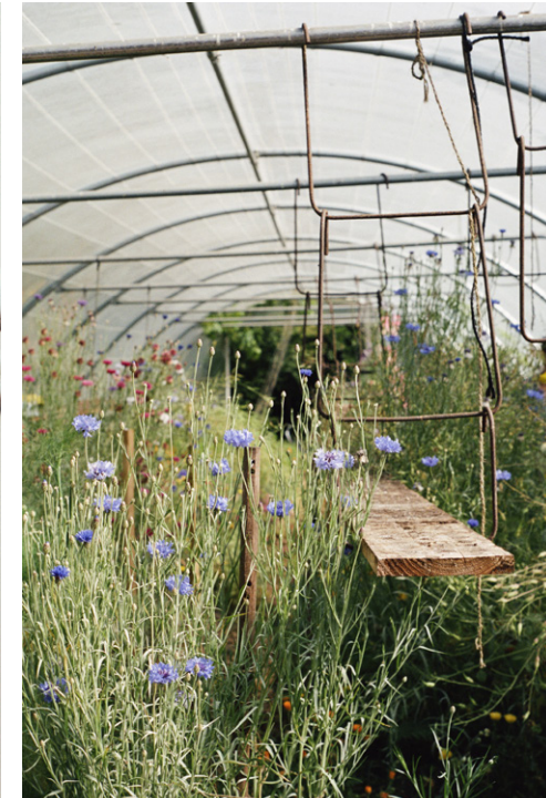
la permaculture article informatif