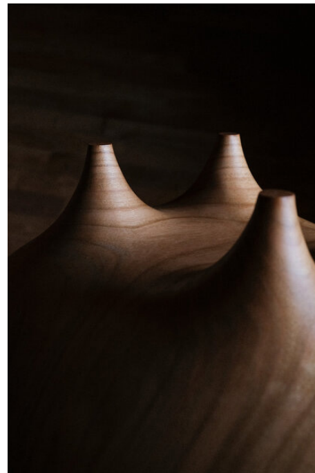
Etienne Bailleul interview