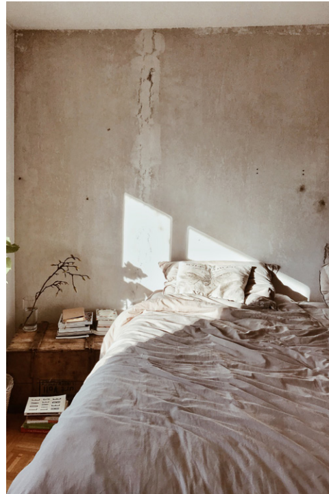
huiles essentielles & sommeil conseils & outils concrets