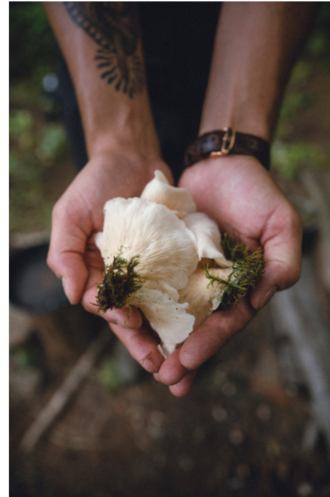
La cuisine sauvage