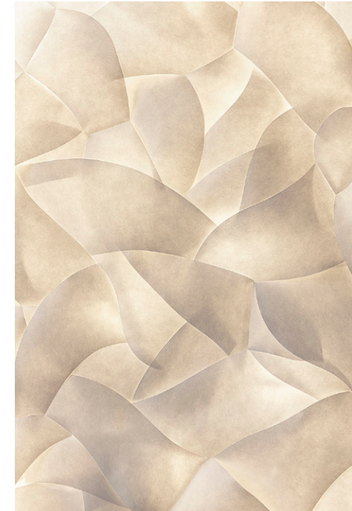
Studio Ammó article